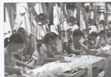
► Los países emergentes basan su producción en la industrialización asentada en bajos salarios y en la exportación de manufacturas baratas.