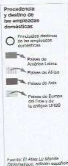
► Un ejemplo de la globalización del mercado laboral.