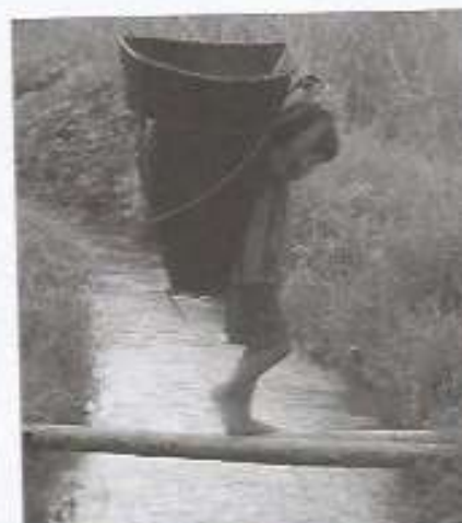
► Trabajo infantil. Niño cargando una cesta (India).

Entre los problemas laborales sobresalen el paro, que reduce los ingresos de las personas y de la sociedad; la discriminación laboral de las mujeres, pues reciben salarios inferiores a los hombres, y el trabajo infantil, que afecta especialmente a los países subdesarrollados.