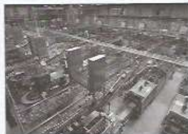
► Los países de la Tríada basan su producción económica en la alta tecnología industrial y agraria.

El consumo de bienes es muy reducido, debido al bajo nivel de vida de sus habitantes. Estos espacios corren el riesgo de quedar marginados de los intercambios económicos mundiales y acentuar su retraso.