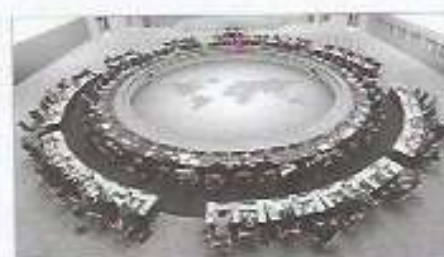
► Reunión plenaria del G20.

En una situación de competencia perfecta , como en el esquema superior, los precios bajan si la oferta es mayor que la demanda. En caso contrario, los precios suben.