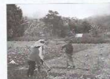
► Las áreas económicas atrasadas basan su producción en las actividades agrarias y las industrias tradicionales.