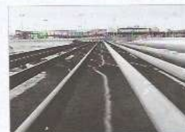
► Algunos países de Oriente Próximo deben su pujanza económica a la exportación de petróleo y gas natural.